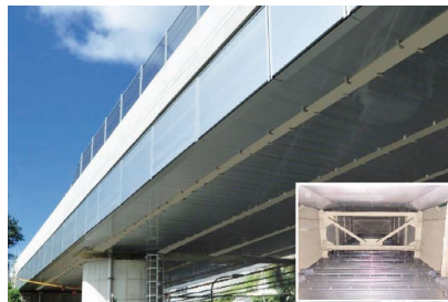
cusa設置事例 (外観および内観状況)

橋梁の維持管理・点検用の常設足場です。アルミ合金製のため高い耐食性と耐候性を備えています。軽量なため人力での施工が可能で、橋梁内部からの取付け・取外しも可能な構造となっています。床面がフラットなため暗所となる空間でも歩きやすく台車運搬も可能な安全性・利便性の高い常設足場です。また、高さ2mから重さ300kgのコンクリート片の落下にも十分耐え得る強度を持ち、コンクリート剥落や付属物落下などによる第三者被害の防止対策を行うことができます。